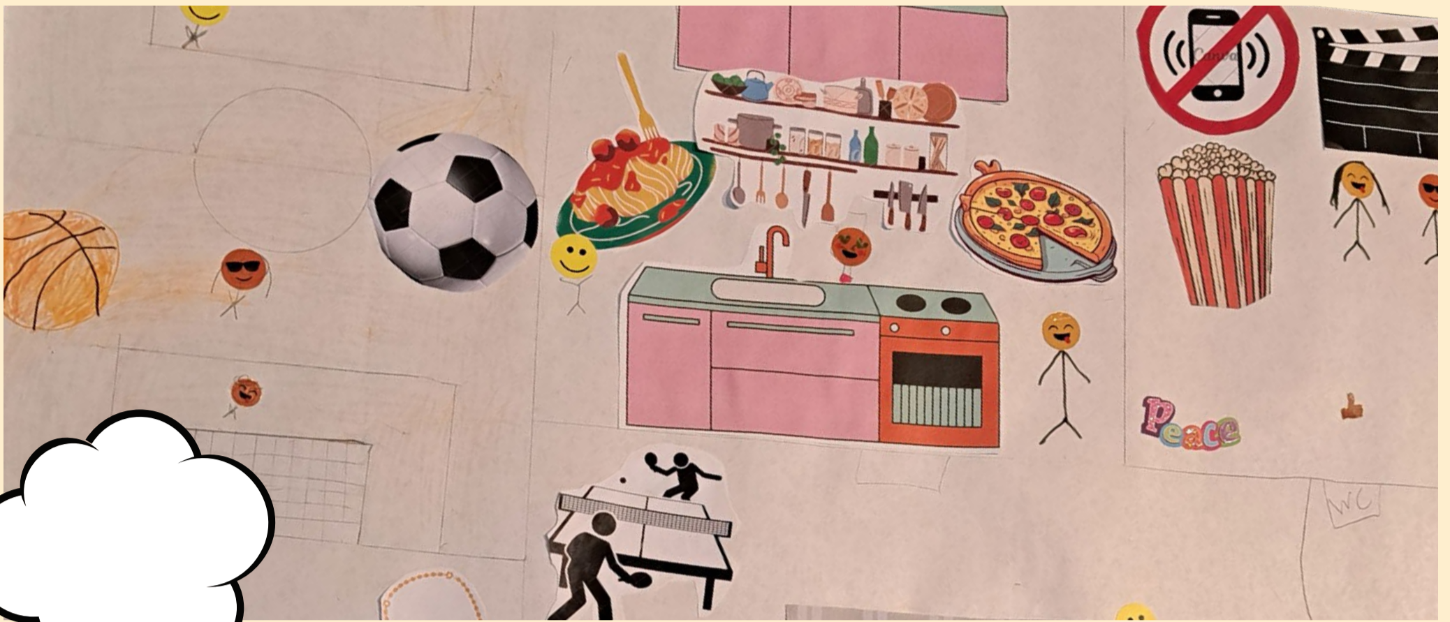
Billedet viser en af børnenes drømmeklubber kreeret som en collage