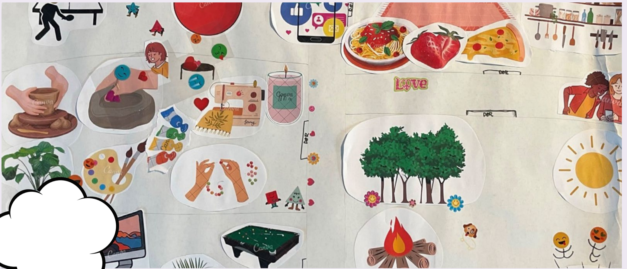
Billedet viser en af børnenes drømmeklubber kreeret som en collage