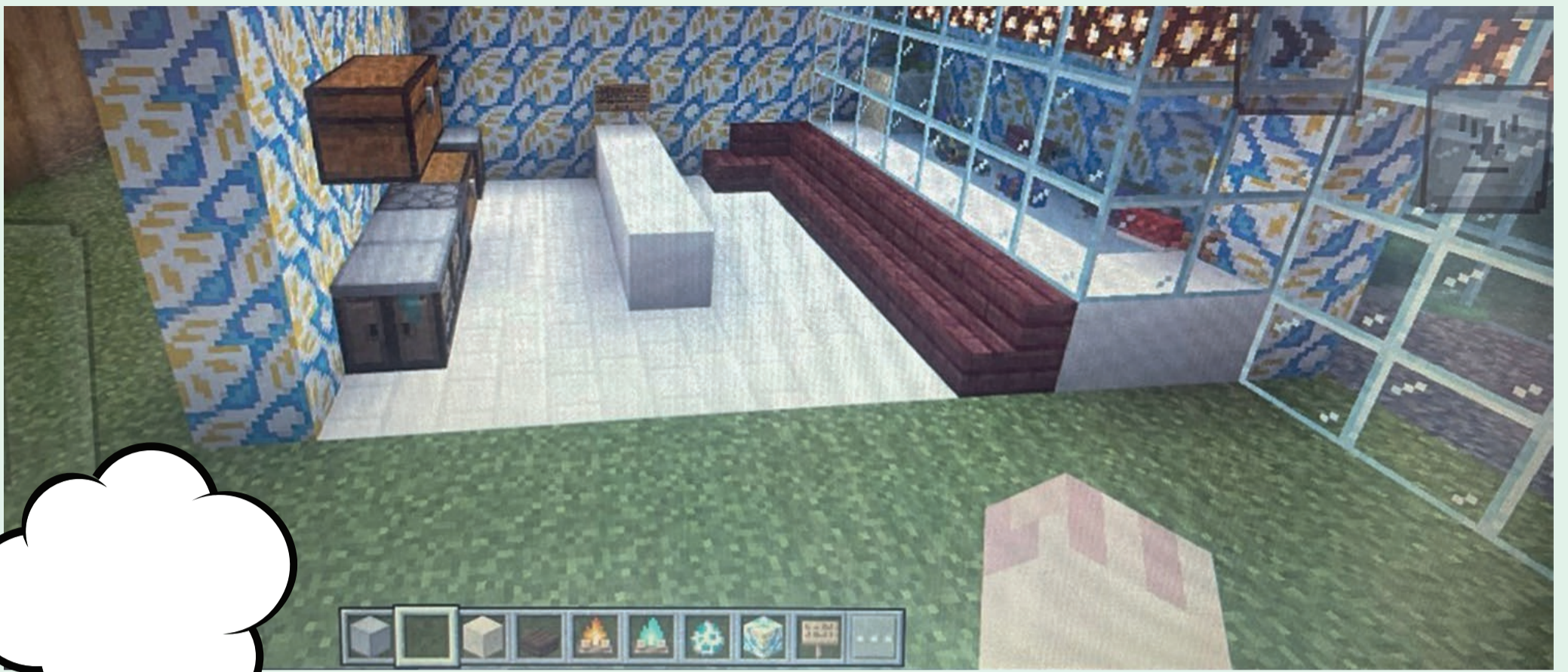
Billedet viser et screenshot af køkkenet i en af børnenes drømmeklubber bygget i Minecraft Education